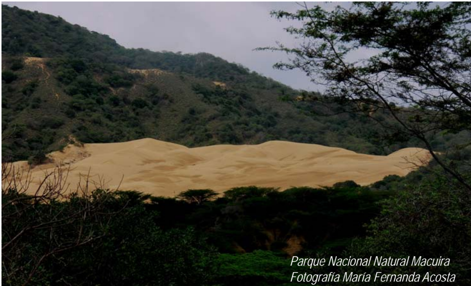
Parque Nacional Natural Macuira